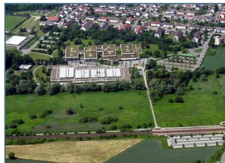
Schule mit Sporthalle und Stadtbahnhaltestelle

Sie dauert drei bzw. dreieinhalb Jahre. Die Einjährige Berufsfachschule wird nach erfolgreichem Abschluss mit einem vollen Jahr auf die Ausbildungszeit angerechnet.