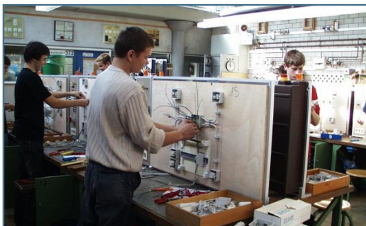
Elektroniker bei Installationsarbeiten