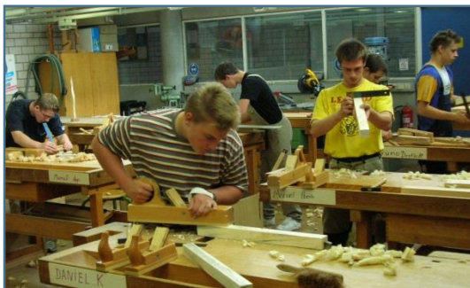
Tischler bei der Holzbearbeitung