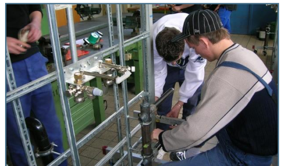
Anlagenmechaniker an der Montagewand