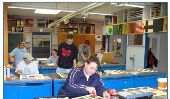
Maler beim Gestalten einer Fläche